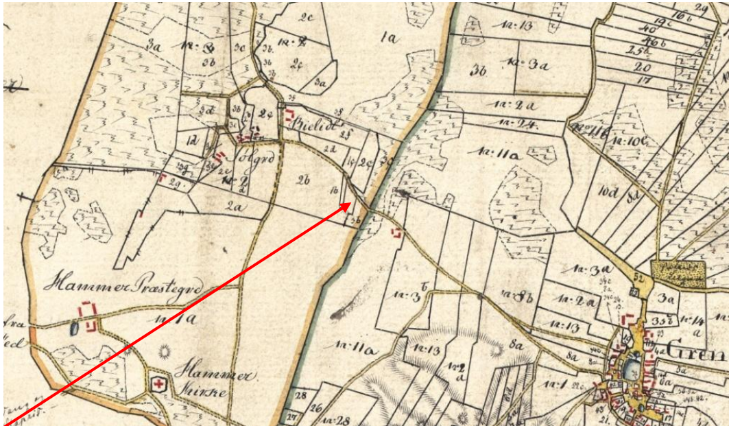
På kortet ses vejen vest ud ad Grindsted mod Bilidt og Sølgaarde. Tæt på grænsen til "Hammer og Sølgaards Jorder" ses Broen, en firlænget gård tegnet ind med rødt.

Kilde: Geodatastyrelsen. Historiske kort på nettet. Udsnit af Sognekort for Hammer Sogn ca. 1816.