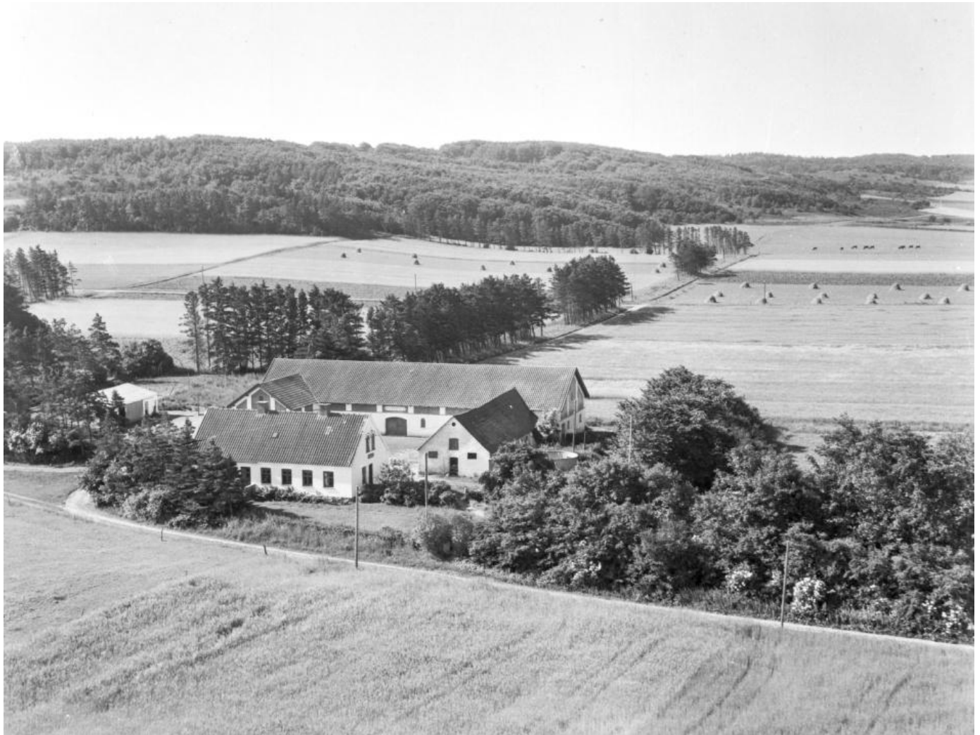
Hammerdam i 1950'erne medens den var i familien Lassen Svendsens eje.