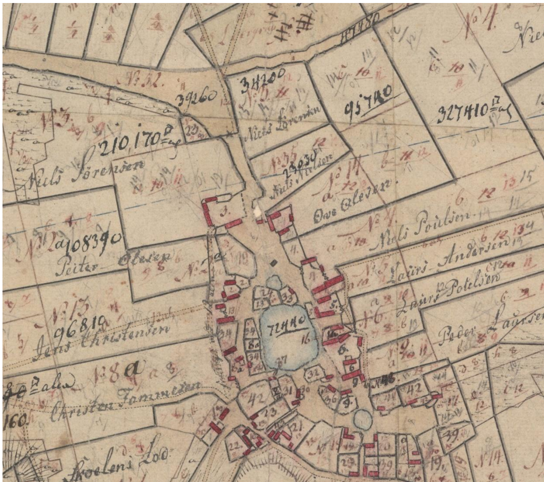
Parcellerne udgår i blokke fra gårdene, der smukt omkranser gadekær og gade. Matrikelkort 1812, Grindsted By, Hammer Sogn, Kær Herred (i brug fra 1812 til 1847).

I 1798 blev Grindsted by opmålt, og året efter blev den udskiftet. For den enkelte fæstebonde medførte udskiftningen, at han nu fik samlet hovedparten af sine agermarker i en blok, som udgik fra gården. Han kunne også have mindre parceller uden for blokken. Udskiftningen indebar, at gårdene så vidt muligt både skulle have andel i jord af god og af mindre god bonitet. Hertil kom, at de skulle have parceller i eng og mose og ret til gærdsel 5 i skovene. Der var nu ikke megen skov tilbage i området. Ikke mindst efter at svenskekrigene i 1600-årene havde gjort et stort indhug i skovene i Hammer Bakker.