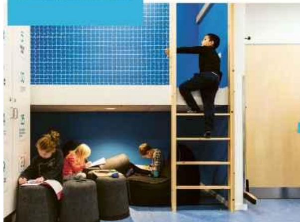
Grindsted Skole vist i forbindelse med den internationale arkitekturkonference i juli 2023.

Det lykkedes dog initiativrige og vedholdende borgere gennem et intenst lobbyarbejde at få bygget hal og boldbaner i slutningen af 1970'erne.