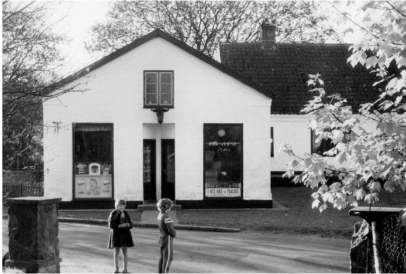
Slagtergaarden på Uggerhalnevej fotograferet i begyndelsen af 1960erne.

Foreningslivet blomstrede i landsbyen , Borgerforeningen startede sit virke i 1932 og havde bl.a. fortove og gadebelysning på dagsordenen. GIF, Grindsted Idrætsforening begyndte en lang karriere, primært med håndbold på programmet. Grindsted blev et lille håndboldmekka.