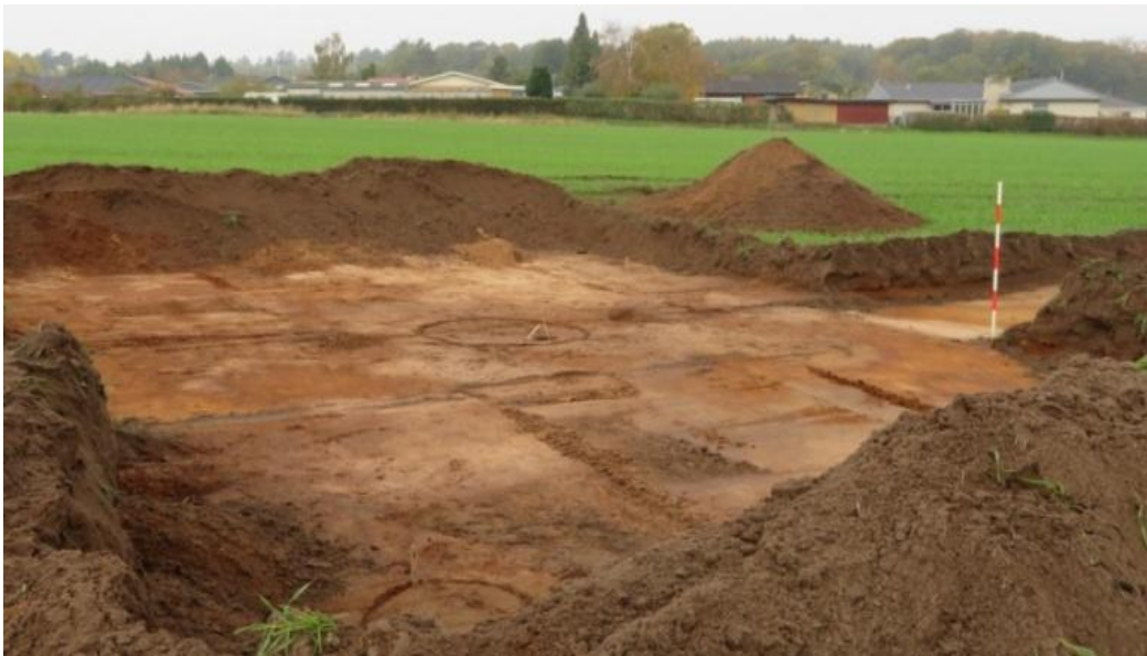
Indledende arkæologiske undersøgelser på mark sydøst for Tranevejskvarteret 2020.

Der har dog boet mennesker langt tidligere. I en periode i Bronzealderen (1700 – 600 f. Kr.), har foreløbige arkæologiske undersøgelser fra 2020 vist rester af en art bebyggelse på en bakke skrånende ned mod et vådområde.