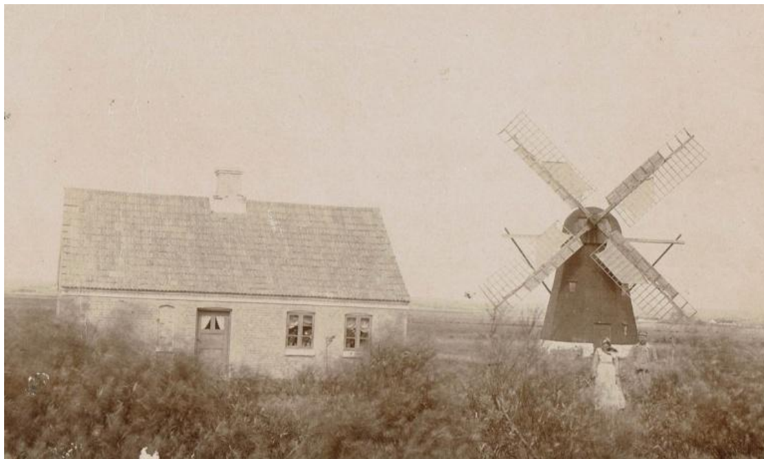
Møllen i Grindsted 1914.