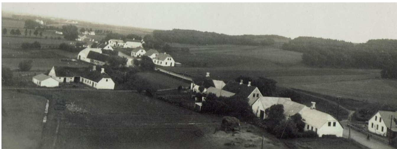
Grindsted set mod sydøst fra Mejeriets skorsten omkring 1935. Nyd de hvidkalkede gårde og huse ved Uggerhalnevej.

Der blev oprettet telefoncentral i 1916 i en gård, beliggende hvor vejen til Vodskov, "Gennem Bakkerne", startede. Centralen forblev stort set i familien Fogth Hansens varetægt frem til 1970, hvor den blev automatiseret.