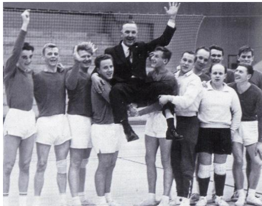
GIF rykkede i 1966 op i Mesterrækken. Kilde: GIF 50 år.

Foreningslivet blomstrede i landsbyen , Borgerforeningen startede sit virke i 1932 og havde bl.a. fortove og gadebelysning på dagsordenen. GIF, Grindsted Idrætsforening begyndte en lang karriere, primært med håndbold på programmet. Grindsted blev et lille håndboldmekka.