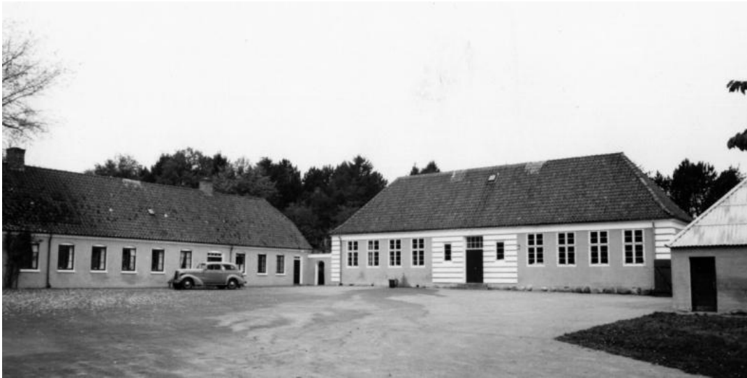
Grindsted Skole med ældre bygning fra 1868 til venstre. Ny skolebygning fra 1918 midtfor, tegnet af arkitekt Hother Paludan, Aalborg.

Landsbyen Grindsted udviklede sig uendelig langsomt. Gårde og huse var fæsteejendomme under Wraa gods, Langholt Hovedgaard og Attrupgaard. Udskiftningen af byen i 1799 medførte, at den århundredårige gamle driftsform med fællesdrift blev opgivet. Den enkelte gård fik samlet sine marker i "klumper", bønderne købte sig efterhånden fri af deres fæsteforpligtelser og lidt efter lidt blev gårdene flyttet ud på deres marker.