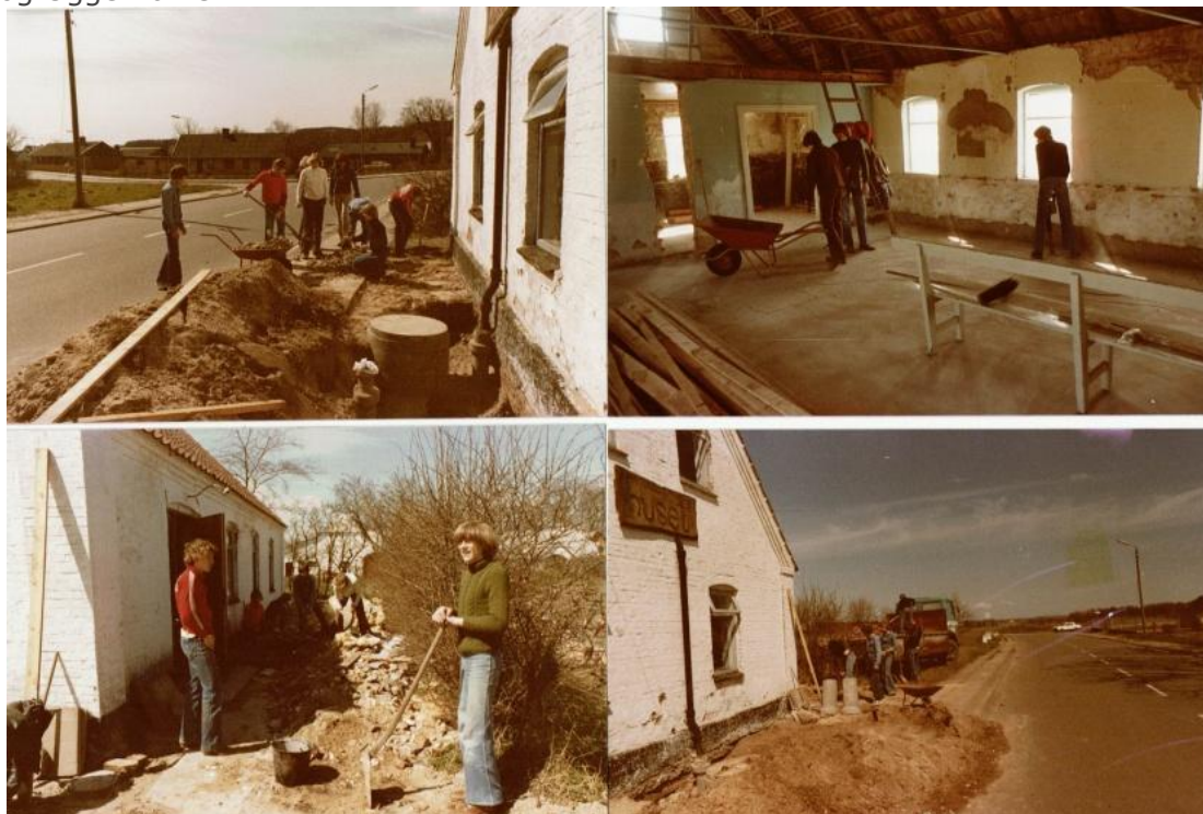
Missionshuset under ombygning til Ungdomshus.

År 1900 blev Missionshuset opført. Det blev langt senere, i slutningen af 1970'erne, ombygget til Ungdomshus . Det var driftige borgere, som købte og omforandrede huset til glæde for ungdommen i Grindsted og Uggerhalne.