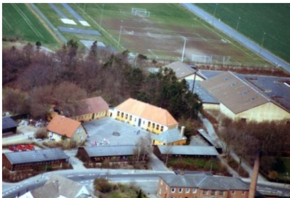
Grindsted Skole med barakker i andre skolebygninger i forgrunden. I baggrunden nybygget hal og nyanlagte idrætsbaner, flot og hensigtsmæssigt placeret. Foto 1980. Horsens-Hammer Lokalhistoriske Arkiv.

Det lykkedes dog initiativrige og vedholdende borgere gennem et intenst lobbyarbejde at få bygget hal og boldbaner i slutningen af 1970'erne.