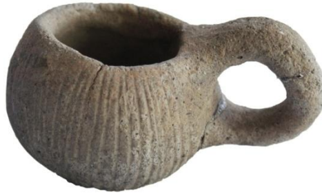
Drikkekop fra jernalderen.