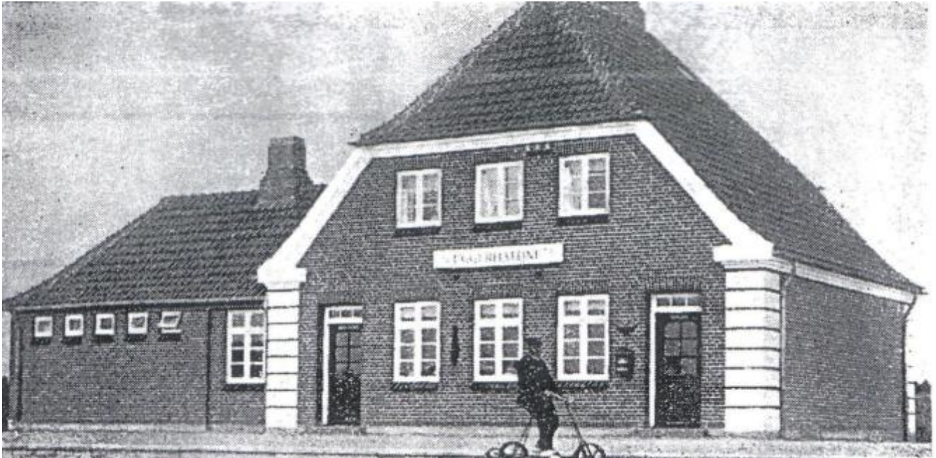
Uggerhalne station omkring 1924