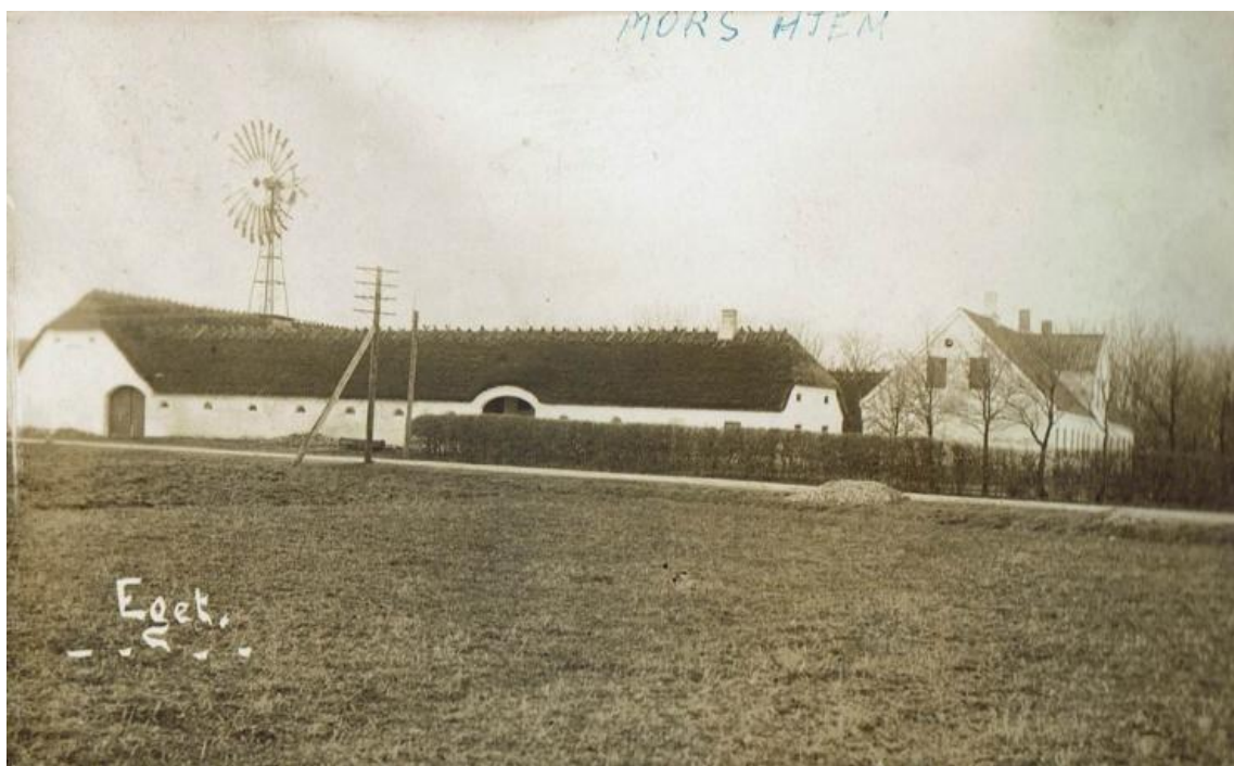
"Eget" begyndelsen af 1900-årene. I dag er kun stuehuset tilbage.