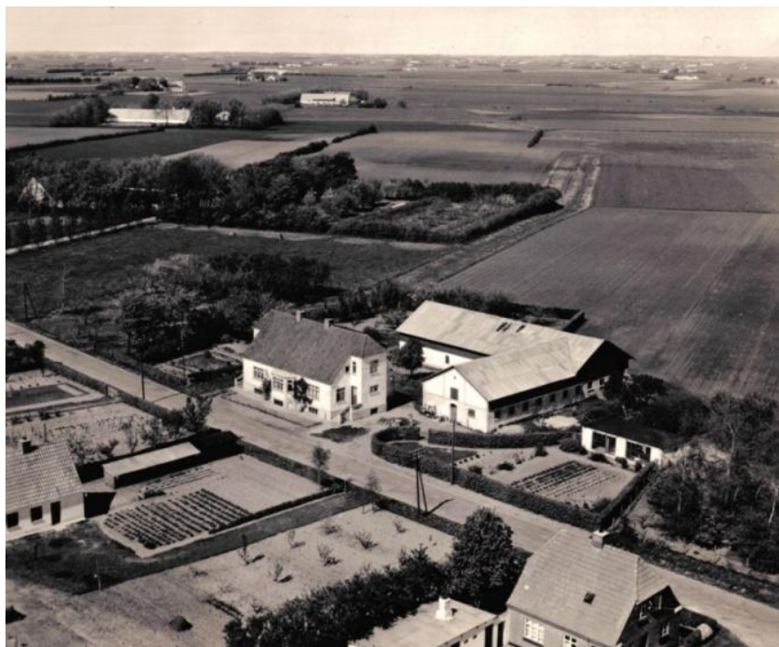
Landbrugsejendommen "Ny Uggerhalne" hvor der i 1920'erne var købmandsforretning. Bemærk de velholdte haver ved huse langs Grindstedvej.

Ved kommunalreformen i 1970 blev Uggerhalne og Kinnerup, sammen med resten af Hammer og Horsens sogne, en del af Aalborg Kommune.