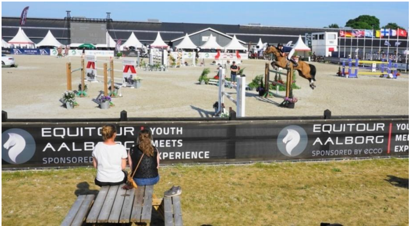
Equitour blev i flere år afholdt på Helgstrands anlæg i Uggerhalne.