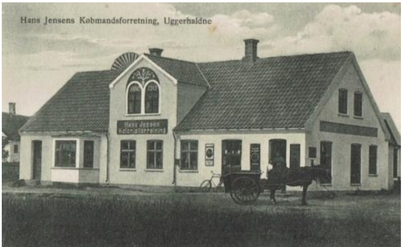
Hans Jensens Købmandshandel.