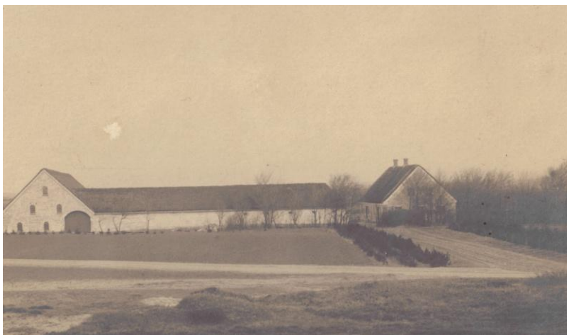
"Uggerhalnegaard" i begyndelsen af 1900-årene. Gården er revet ned. Der er i dag rideskole mm.