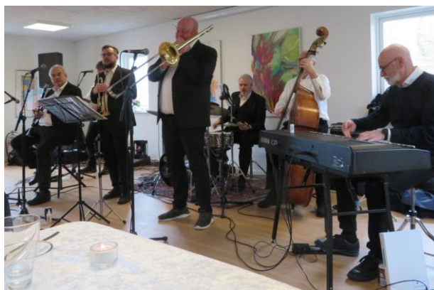
Frokostjazz med Advokatens New Orleans Jazz Band.

December: Nissehuer på HammerHattene ved Trekanten i Uggerhalne/Kinnerup.