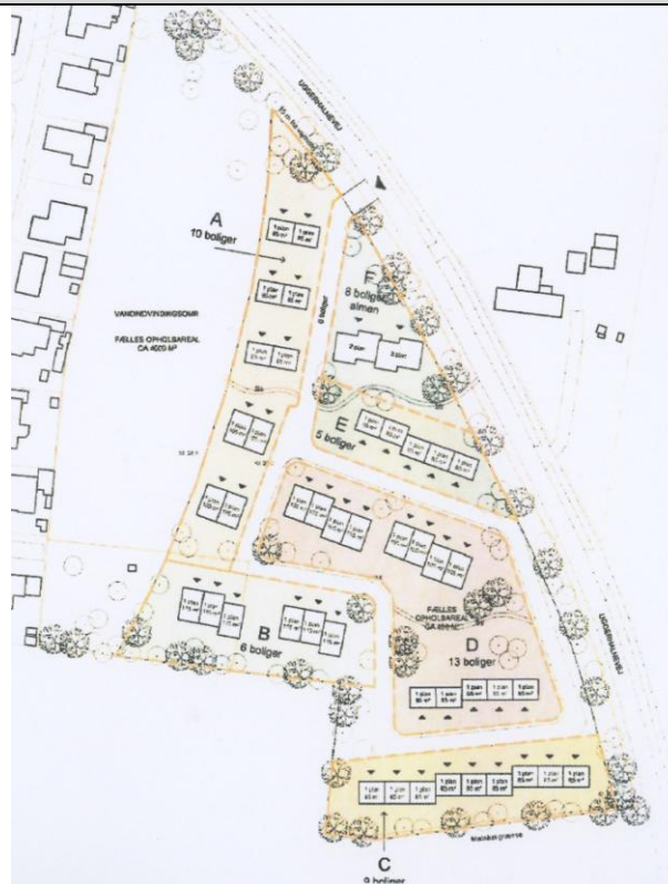
Foreløbig skitse til kommende byggeri på Hammertoften.

Der er udstykningsplaner for et område ved Andelshusene i Uggerhalne . Ejeren har oplyst, at han p.t. forbereder og klargør arealet, men har endnu ikke fastlagte planer for realiseringen af byggeprojektet.